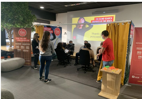
Learning lab The Kube, TBS Education

« We aim to promote educational wellbeing building on the principles of providing equal opportunities, inclusivity, and fairness in the Thesis tutor selection process for both tutee and tutor. »