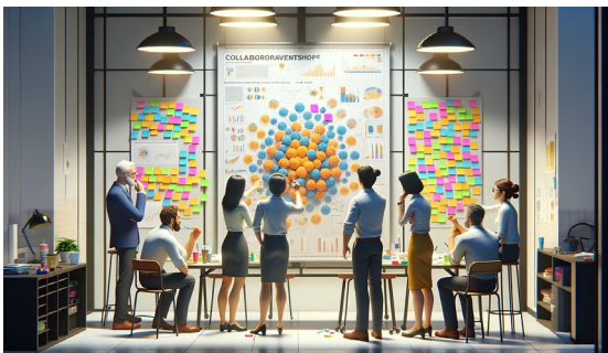
Illustration réalisée avec Dall-e

« Ce que j'apprécie le plus, c'est la possibilité d'explorer les projets des autres à mon propre rythme et d'échanger sur le nôtre dans un cadre détendu.